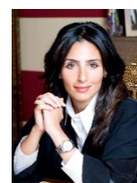
ラザン・アル・ムバラク

JCAS 冒頭には、世界の非政府アクターが参加する Race To Zero の取り組みをリードするハイレベルチャンピオンのラザン・アル・ムバラク氏が登場します。ムバラク氏は、長きにわたり世界各地で先進的な環境保護と種の保存の活動をリードされ、2021年から国際自然保護連合（IUCN）の会長を務めています。COP28 に向けて、日本に寄せられるメッセージにご注目ください。