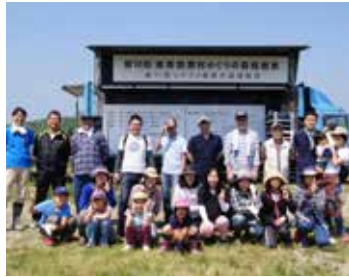
参加してくれた皆さん

今回も従業員とその家族を合わせ、30名以上が参加した植樹・育樹祭となりました。毎回参加するたびに苗を植えたり、わらを敷き詰めたり、なわを張ったりするとき、子供たちの真剣で楽しそうな姿が印象的です。親子で、従業員同士で、これからも楽しみながら森づくりをしていきたいと思えます。(高橋)